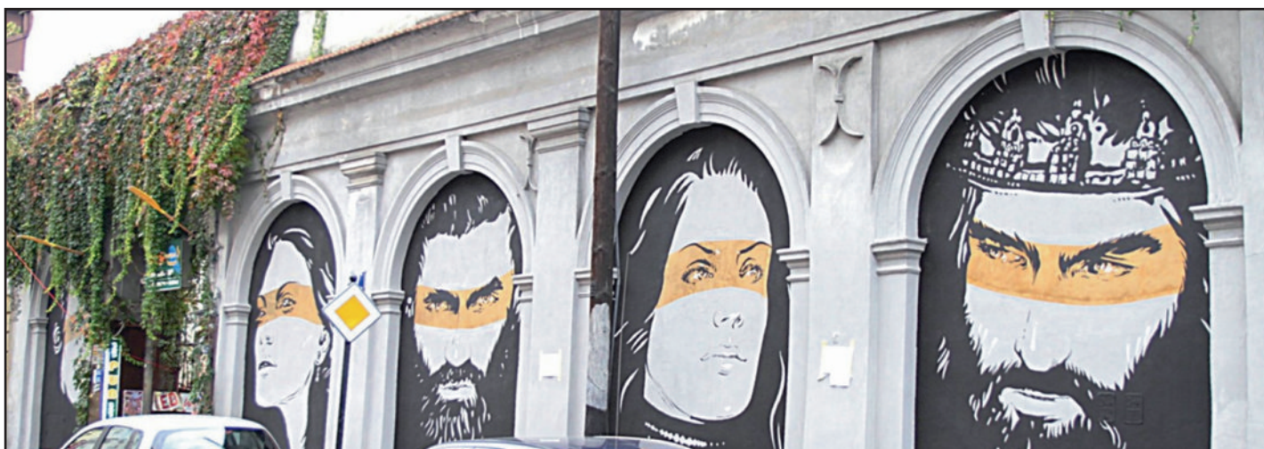
Projekt "Kazimierskie murale historyczne w Krakowie" zrealizowany w ramach Budżetu Obywatelskiego zwyciężył w ogólnopolskim konkursie „Mieszkam tu! – Mądre pomysły na mądre miasto”, organizowanym przez Portalsamorządowy.pl oraz Fundację Napraw Sobie Miasto

Rewitalizacja skweru ma na celu poprawienie estetyki miejskiej w Śródmieściu. Projekt zakłada posadzenie traw ozdobnych na odcinku pomiędzy ulicami Smoleńsk i Piłsudskiego. Koszt: 25 000,00 zł.