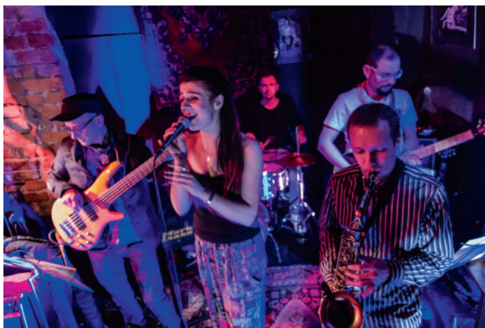
Bajazzer