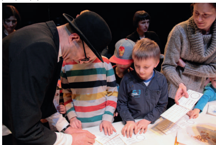
Akademia Pana Piórko, fot. Agnieszka Perc

nego. Występować będą artyści zawodowi oraz grupy amatorskie, reprezentujące instytucje kultury, szkoły muzyczne, szkoły tańca. Natomiast uzupełnieniem prezentacji będą działania angażujące publiczność – warsztaty tańców dworskich gwarantujące dużo uśmiechu i dobrą zabawę, a także mnóstwo propozycji dla dzieci.