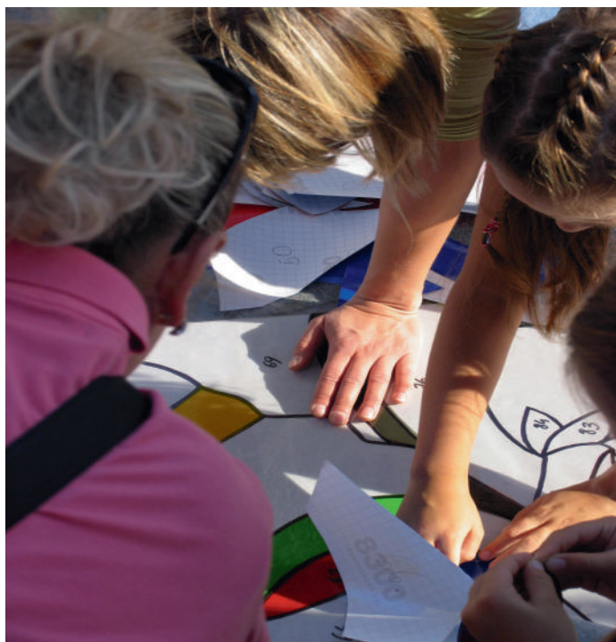
Warsztaty robienia witraży

najbardziej lubią aktywność, przygotowaliśmy dla nich ciekawe warsztaty: dla muzykujących „Muzyczną Krainę”, dla małych plastyków zajęcia z projektowania witraży i malowania na szkle, dla lubiących pływać – tańce z wyobraźnią, a dla sportowców – warsztaty gimnastyki akrobatycznej oraz pokazy akrobacji.