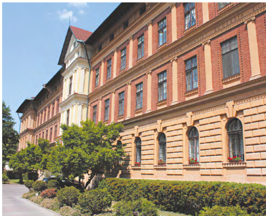
fol. Dom Pomocy Społecznej im. L. i A. Helclów

Opiekunowie rodinni podsumowali projekt „Poradnia opiekunów rodzinnych u Helclów” i przygotowują się do zajęć w 2020 r. w nowym projekcie „Opiekun domowy chorego – warsztaty u Helclów”