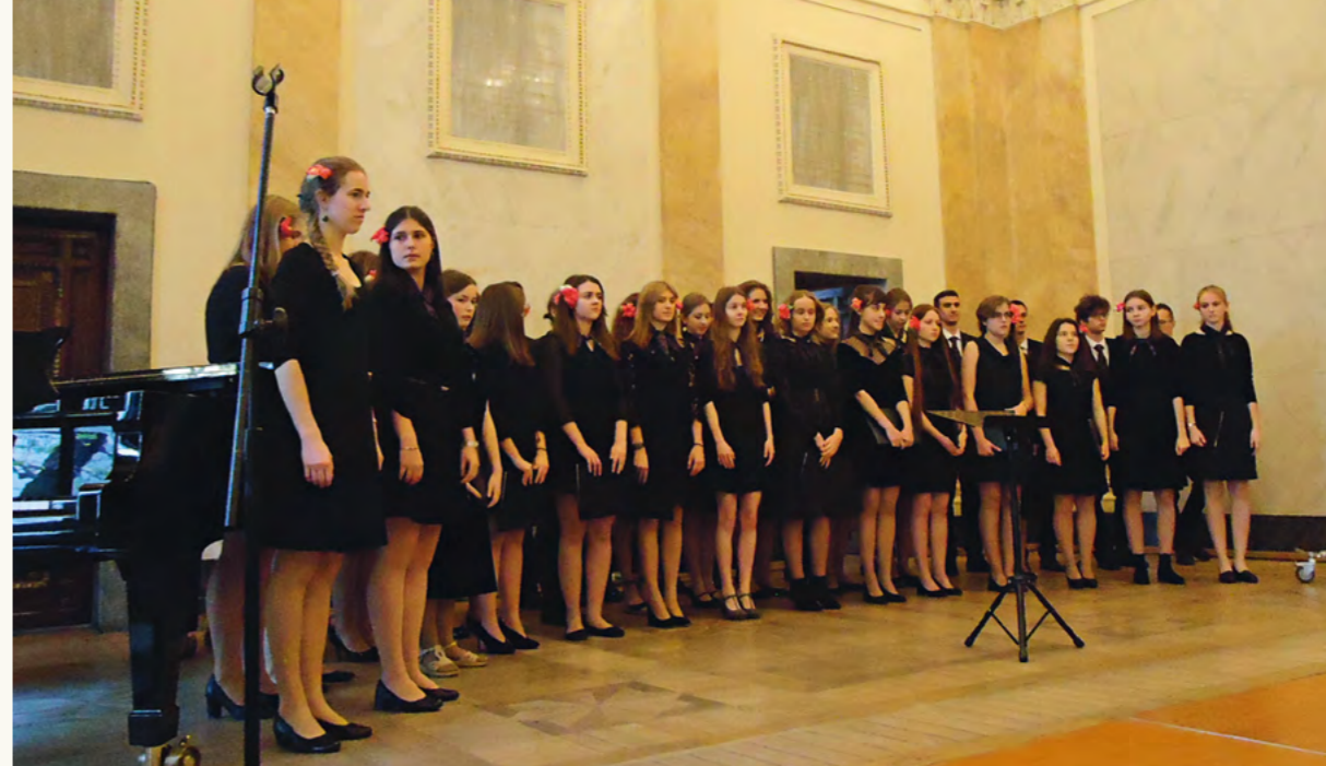
Chór V LO im. A. Witkowskiego