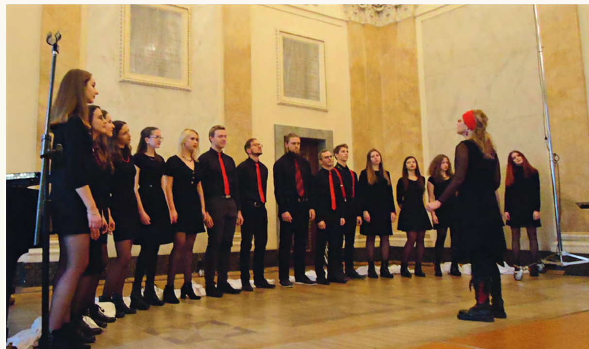
Zespół Wokalny Jaszczwóry