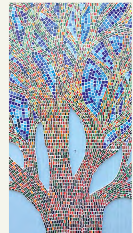
fol. Elżbieta Wysakowska-Walters

zapraszamy do Galerii 2 Światy (ul. Brzozowa 14) na przedpremierowy pokaz filmu dokumentalnego Igora Kaweckiego pod tytułem „Oko Boga” – poetyckiej impresji o skwerze przy ul. Brzozowej.