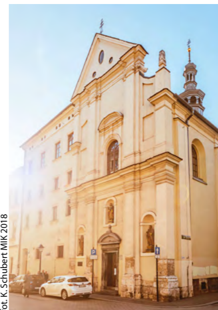
fot. K. Schubert MİK 2018

Druk: DRUKARNIA ROMA-POL STEFAN PAŁKA, ul. Rydlówka 5, 30-363 Kraków, tel./fax +48 12 623 73 72, +48 511 999 660