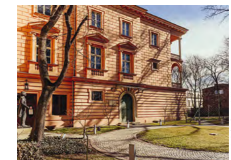
Pałac Pusłowskich w Krakowie

Zwiedzaniu i oprowadzaniu towarzyszy specjalnie przygotowany program – wykłady, wystawy, gry i zabawy, warsztaty dla dzieci, pokazy i koncerty. Wstęp do wszystkich zabytków i wszelkie aktywności realizowane podczas Dni Dziedzictwa są bezpłatne. Na niektóre wydarzenia obowiązuje wcześniejsza rezerwacja miejsc.