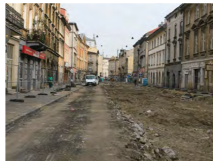
fol. E. Kruk