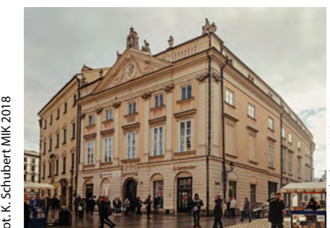
Pałac Potockich w Krakowie

W tym roku organizator Dni Dziedzictwa – Małopolski Instytut Kultury w Krakowie – zaprasza do: