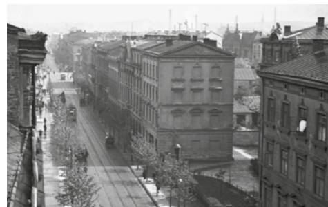
ul. Starowiślna rok 1928

Zarząd Transportu Publicznego w Krakowie