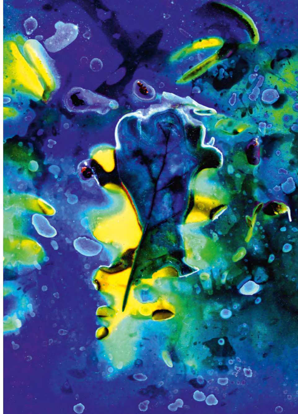
Bez tytułu, Radek Kłeczek