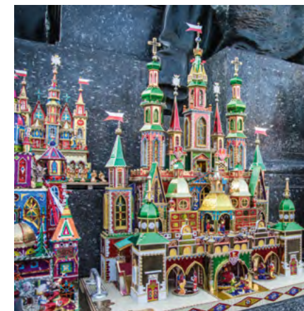
fol. Bogusław Świeżowski, Kraków.pl