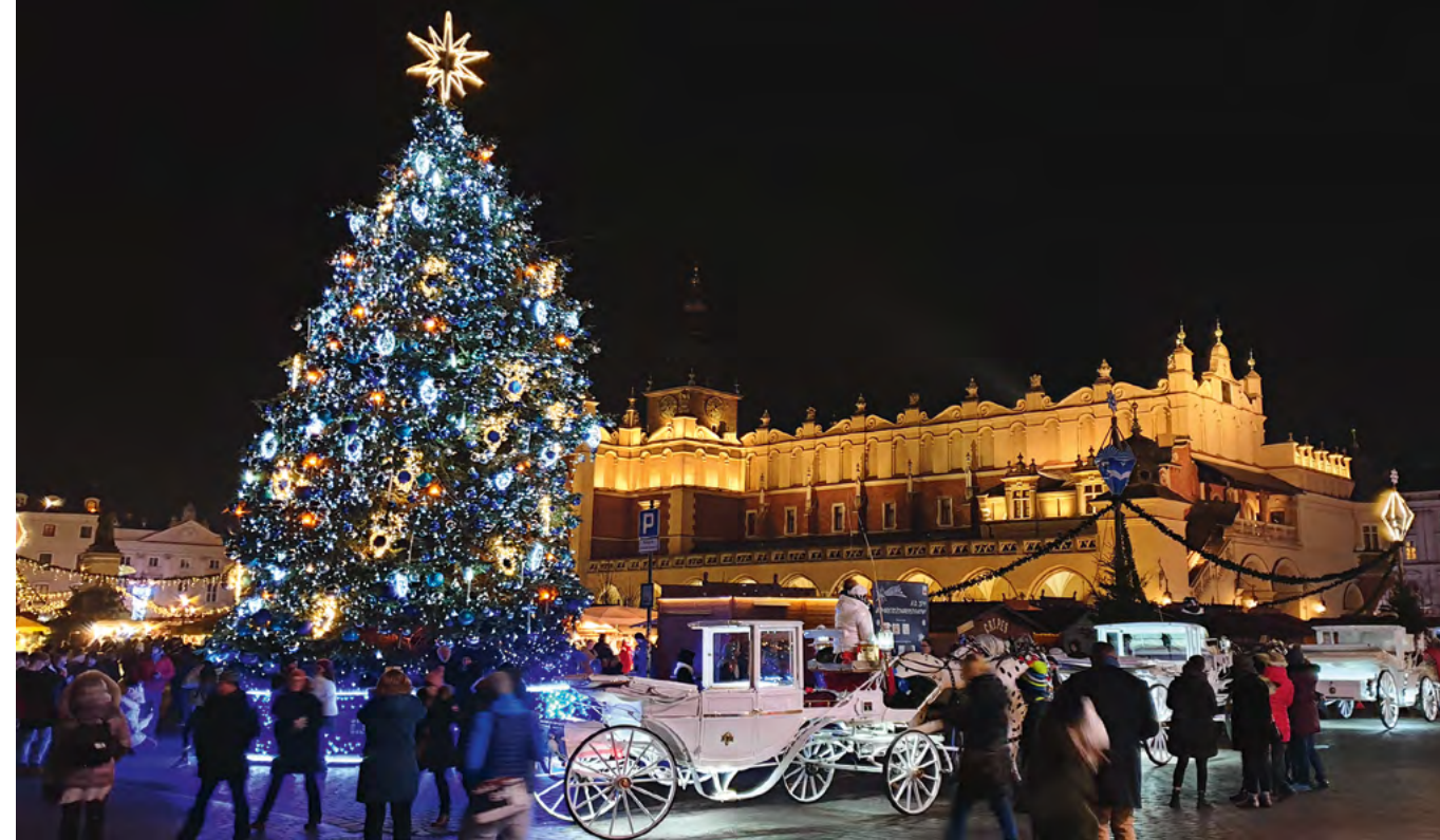
Targi bożonarodzeniowe w 2019 roku