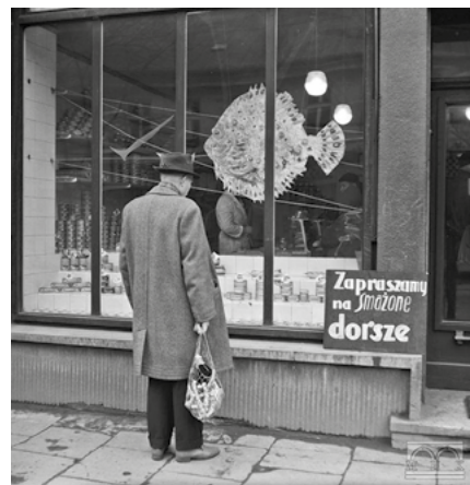
Sklep rybny przy ul. Karmelickiej 16, fot. Józef Lewicki, lata 60. XX w., ze zbiorów Muzeum Krakowa

Obowiązkowym daniem wigilijnym jest karp. Przeważnie podawany na zimno w galarecie – po żydowsku i na ciepło – smażony. Pierwsza wzmianka o jedzeniu karpia – z 18 sierpnia 1292 roku – pochodzi właśnie z Krakowa. Przyjechał wtedy do naszego miasta czeski król Wacław II. Wydano na jego cześć ucztę i podano karpia. To pierwsze odnotowanie, bo karpia ludzie zapewne jadali wcześniej, choć był bardzo drogi.