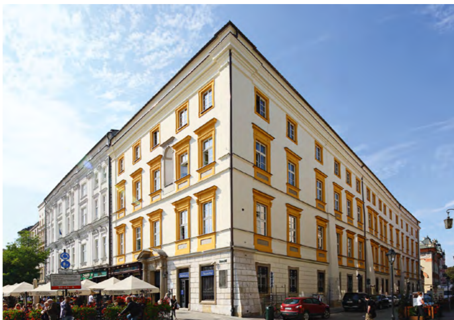
Pałac Pod Krzysztofory

W tym roku, po kilkunastu latach prac budowlano-konserwatorskich, budynek pałacu Pod Krzysztofory przy Rynku Głównym 35 został ponownie otwarty dla publiczności.