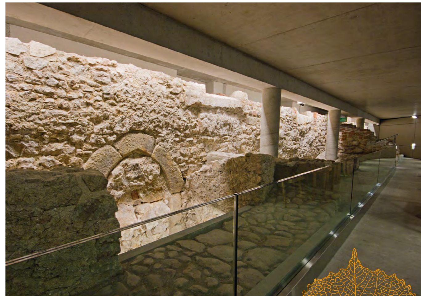
Widok przedproży w pałacu Pod Krzysztofory

W latach 1878–1879 wysoki dach zastąpiono obecnym, co w widoczny sposób przyczyniło się do utraty walorów stylowych budowli. Zespół pałacowy, zdewastowany wieloletnim użytkowaniem i mocno wyeksploatowany, był realnie zagrożony wyburzeniem przed wybuchem I wojny światowej. W 1911 r. budynek nabyła spółka kierowana przez przedsiębiorcę Gustawa