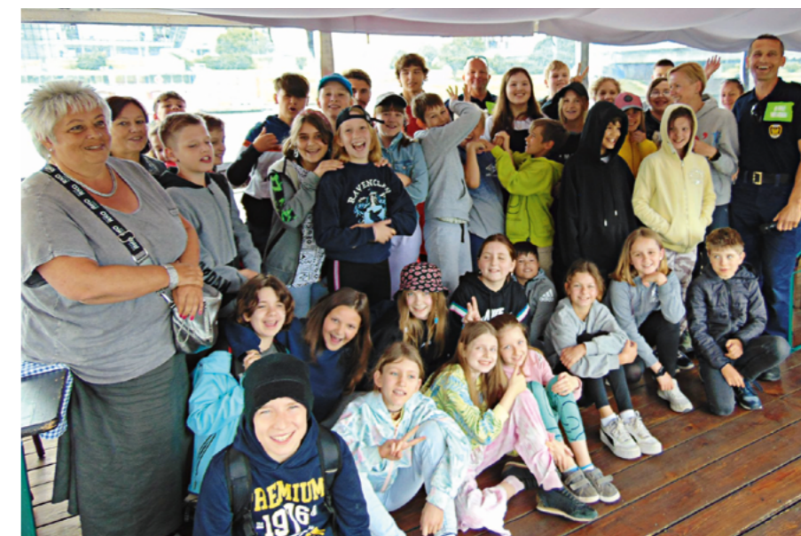
fotografie: Maciej Necel

Maciej Necel Straż Miejska Miasta Krakowa