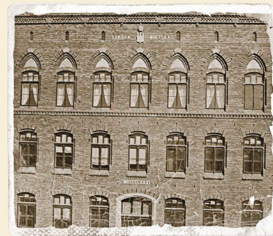
fol. archiwum SP 4