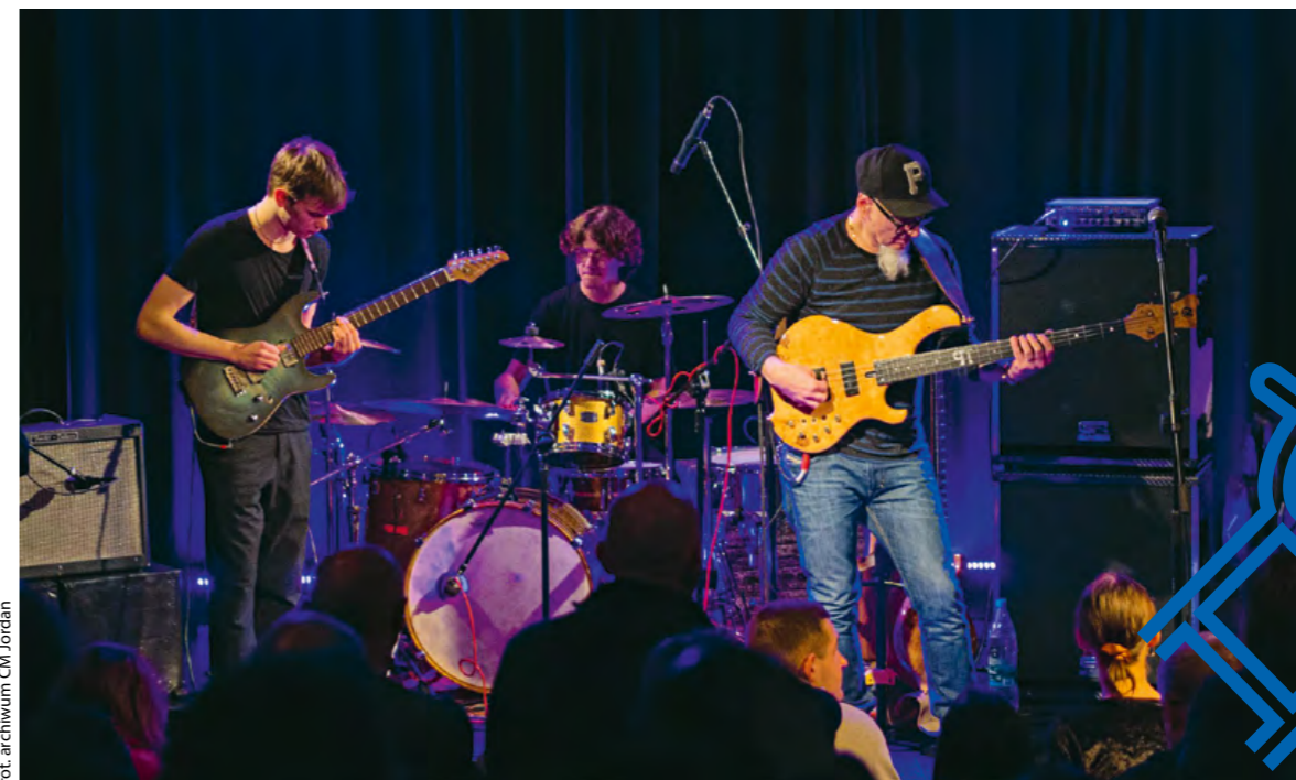
Koncert Pilichowski Band