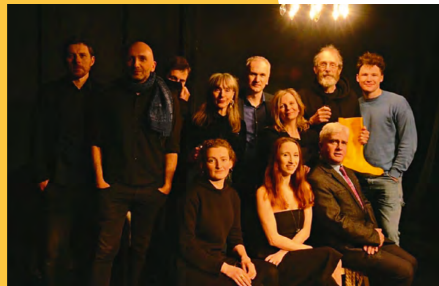
Zespół artystyczny spektaklu Znaczył kapitan po premierze

facebook.com/scenasupernova www.scenasupernova.pl IG: @scenasupernova