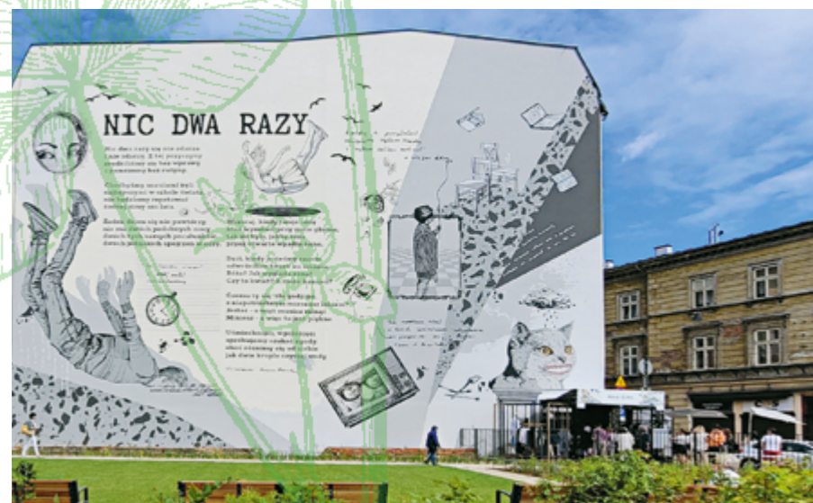
Mural kolektynu 101 Murali dla Krakowa poświęcony Wisławie Szymborskiej