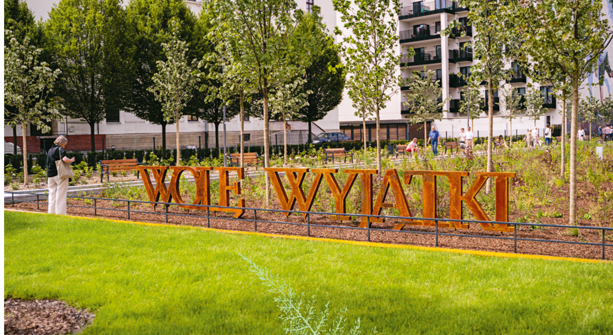
Cytat z wiersza noblistki pt. Możliwości