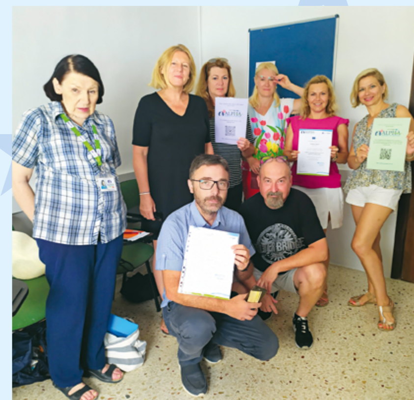
Nauczyciele z X LO pogłębiali wiedzę i zdobywali umiejętności na Malcie