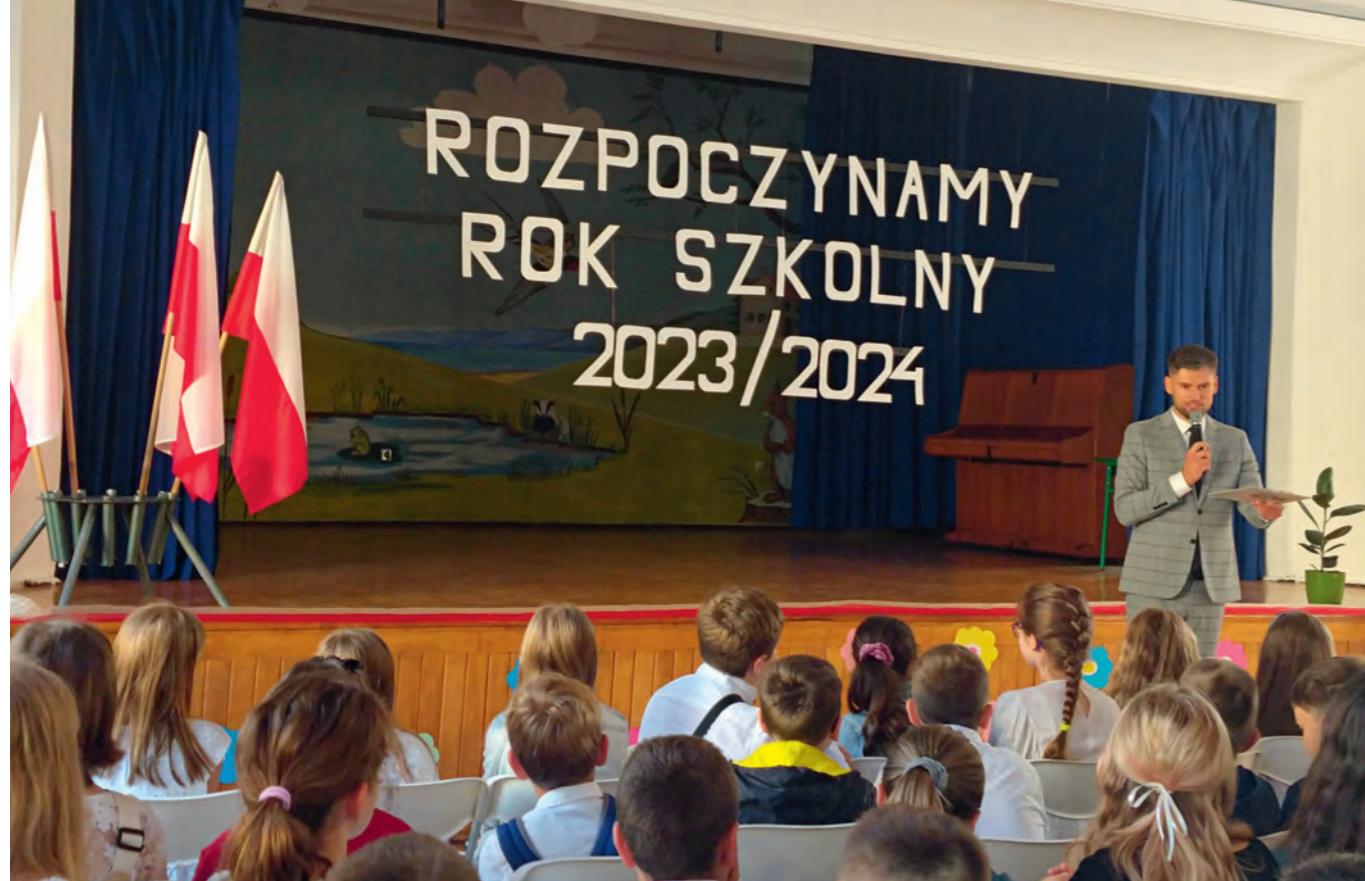
Rozpoczęcie roku szkolnego w Szkole Podstawowej nr 7