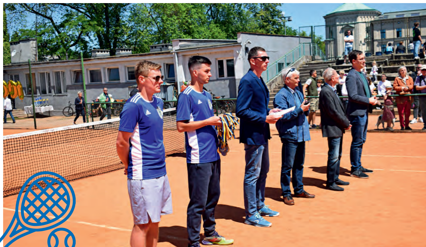
Turniej tenisowy „O Puchar Przewodniczącego Rady Dzielnicy I Stare Miasto” z okazji 100-lecia Klubu, czerwiec 2023 r.