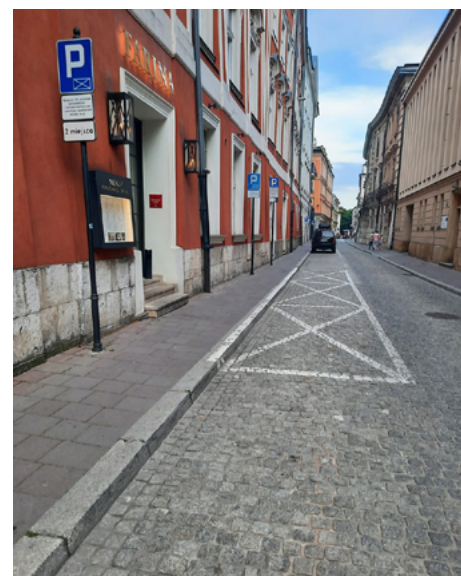
Ulica św. Marka