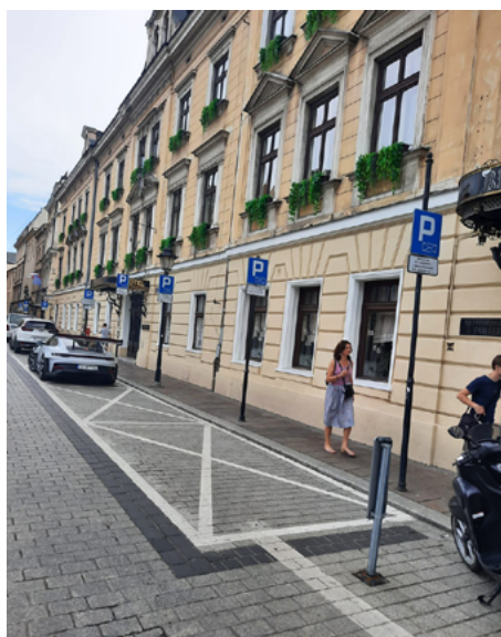
Ulica Szpitalna

Należy podkreślić, że są również koperty oznaczone jako „na czas wyładunku do 20 minut”. Przykładowo przy skrzyżowaniu ul. św. Tomasza z ul. Szpitalną są aż trzy takie koperty w jednym miejscu, a następną znajdziemy przy ul. Szpitalnej w kierunku Małego Rynku. Dodatkowo dochodzą koperty dla meleksów oznakowane „dla pojazdów wolnobieżnych z silnikiem elektrycznym”. Mimo że meleksy mają już wyznaczone miejsca na pl. św. Ducha oraz okupują Mały Rynek od strony Mikołajskiej, to jeszcze na ul. św. Marka przydzielono im sześć kopert, między ulicami św. Jana a Szpitalną, w najlepiej usytuowanych miejscach. W jaki sposób tamtejsi mieszkańcy mają przywieźć swoje ciężkie zakupy i zanieść je do domu?