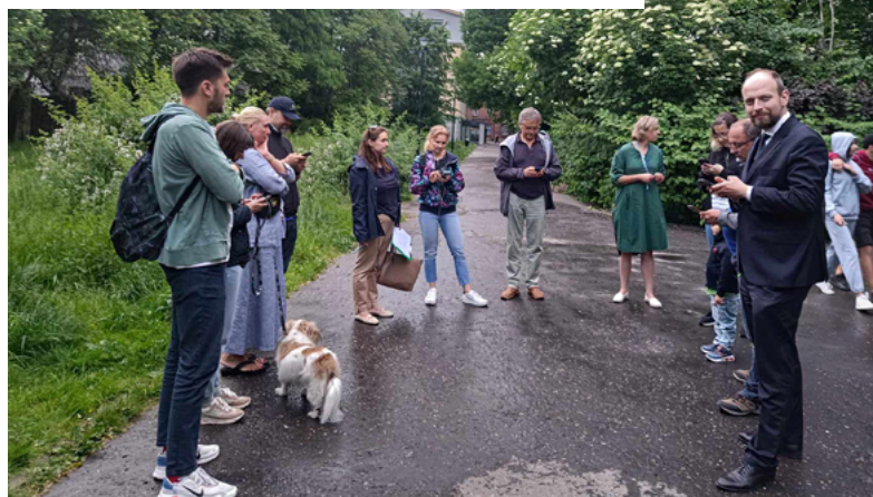
Spotkanie mieszkańców z przedstawicielami Rady Dzielnicy I Stare Miasto w Parku im. Jalu Kurka

Uczestnicy panelu doszli do wspólnego wniosku, iż dla poprawy tej sytuacji konieczna jest kompleksowa pielęgnacja zieleni oraz zainstalowanie monitoringu zintegrowanego z miejskim systemem monitoringu wizyjnego, obsługiwany przez Straż Miejską. Należy również zwiększyć liczbę prewencyjnych patroli Policji i Straży Miejskiej. Służby apelowały o zgłaszanie faktów naruszeń regulaminu parku